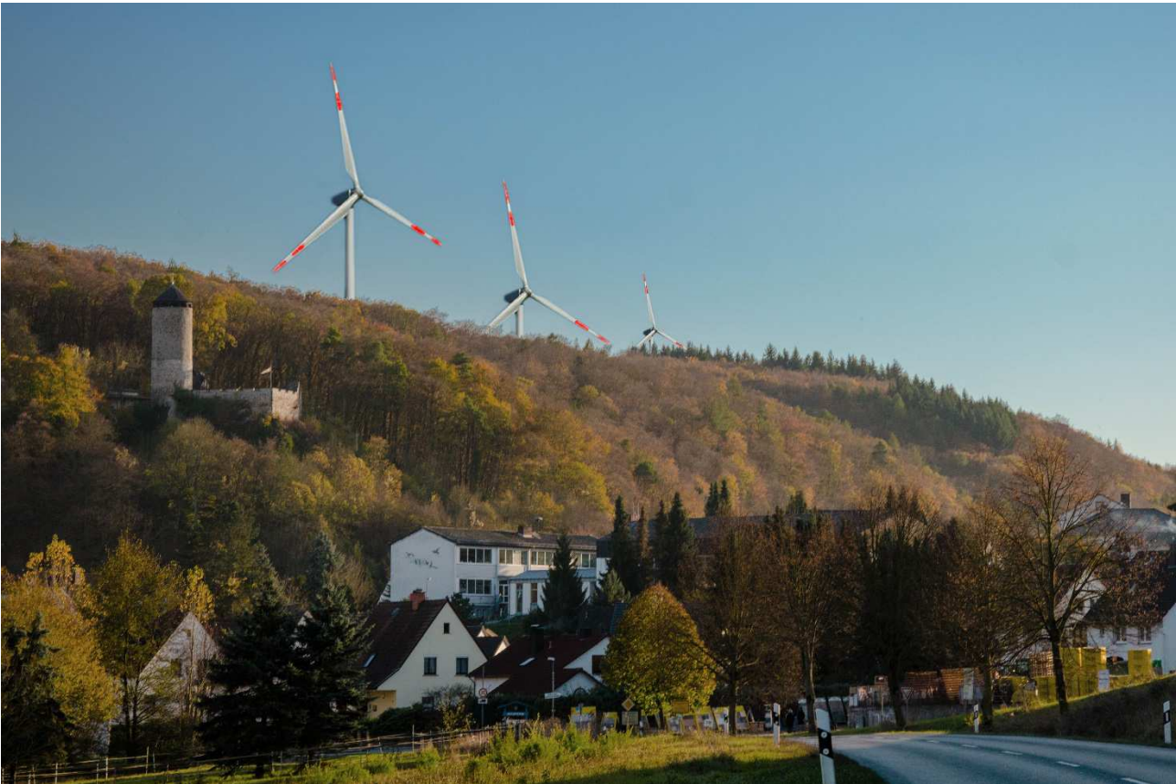
Geplante Windkraftanlage der Firma Jost. Ansicht der Anlagen in maßstabsgetreuer Darstellung zum Ortsbild von Philippsstein.