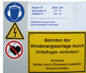
Warnschild im Windpark Hohenahr

Lärmbelästigung durch monotonen sehr tiefen Dauerton, hierdurch können Schlaf- und psychische Störungen hervorgerufen werden. In den Dörfern Philippsstein und Altenkirchen 40 dB(A) (Kühlschrankbetrieb), am Sportplatz Philippsstein und Altenkirchen 50 dB(A) (laufende Klimaanlage) und am Wanderweg entlang 100 dB(A) (Benzin-Rasenmäher) gemäß der Präsentation der Firma Jost. Zusätzlich besteht Verletzungsgefahr durch Eisabwurf in den Wintermonaten im Bereich der Anlagen und am unterhalb der WKAs verlaufenden Wanderweg.